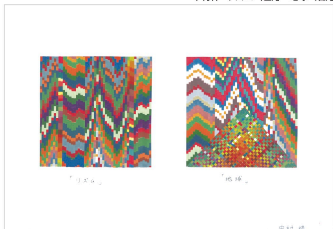
中村梓「リズム (左)」「地球 (右)」