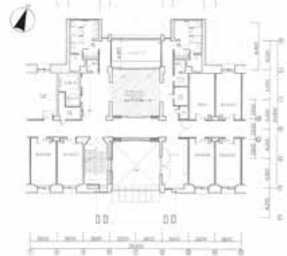
製図法 1(1) RC造コピー 秋葉 雄太